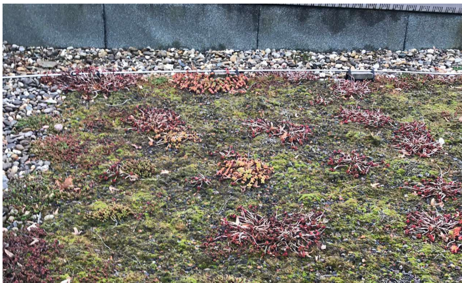
Dieses Bild wurde am 09.11.2019 erstellt

Gewicht im wassergetränkten Zustand incl. Pflanzen ca. 100 - 120 kg/m 2