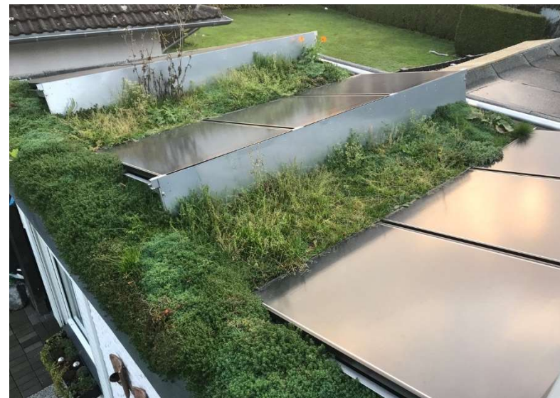
Dieses Bild wurde am 09.11.2019 erstellt

Gewicht im wassergetränkten Zustand incl. Pflanzen ca. 50 - 60 kg/m 2